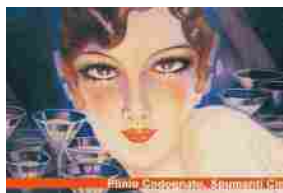
Storia della pubblicità in Italia: 200 opere nella Villa dei Capolavori