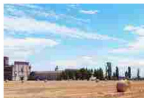
L'estate allo CSAC continua con la mostra Objets trouvés